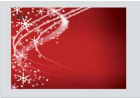
Win4 Plein écran