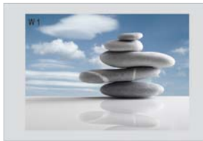
Win1 Plein écran