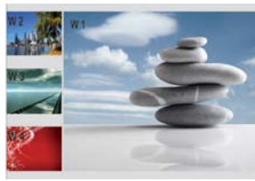
3 x Gauche+ 1 Droite