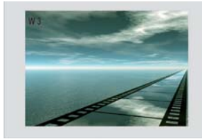
Win3 Plein écran