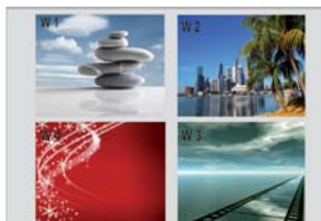
Division de l'écran