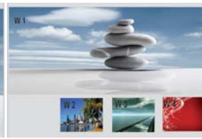
1 x Haut + 3 x Bas