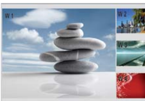
1 x Gauche + 3 x Droite