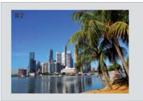
Win2 Plein écran